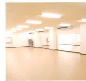
フィットネスルーム