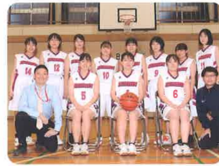
バスケットボール