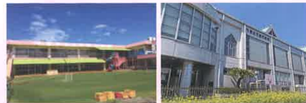
千葉女子専門学校附属聖心ども園 千葉女子専門学校(保育科)