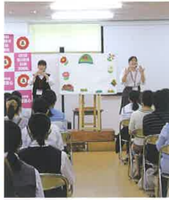
▲オープンスクール(保育実演)