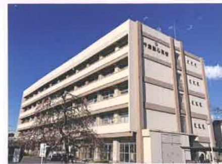
千葉聖心高等学校(全日制普通科女子)