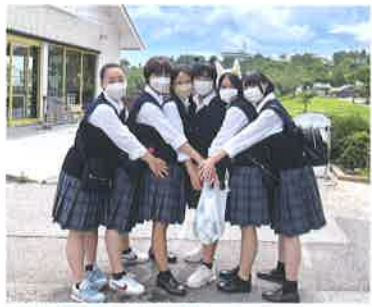
▲校外学習(マザー牧場)